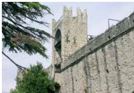
OŠ Cirila Kosmača Piran, Piransko obzidje

V celotnem letu je posebna pozornost namenjena vrednotam dediščine, saj je generalna skupščina Združenih narodov na svojem 56. zasedanju razglasila leto 2002 za leto Združenih narodov za kulturno dediščino. Programski svet je spodbudil šole v Sloveniji k vključitvi v nov projekt, ki ga je pripravila ASPnet v sodelovanju UNESCO kluba Piran