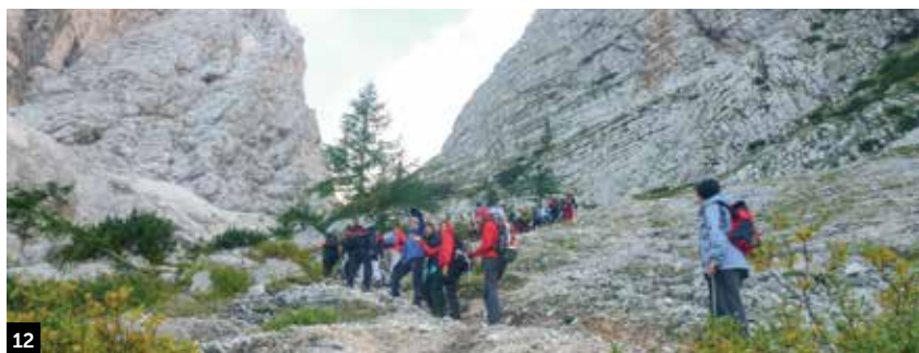
12 Gorniški tabor OŠ 16. decembra Mojstrana