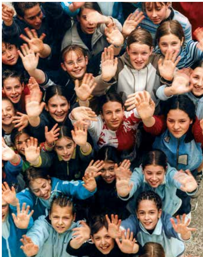
Prava Unesco šola vzgaja in izobražuje za človekove pravice – otroci na vsakoletnem taboru Korenine in krila v Piranu

vzgoja in izobraževanje s človekovimi pravicami, ki vključuje učenje in poučevanje, kjer so spoštovane tako pravice učencev kot učiteljev. Tretji del vzgoje in izobraževanja za človekove pravice pa pomeni opolnomočenje ljudi, da lahko uživajo in uveljavljajo svoje pravice in spoštujejo in branijo pravice drugih. Za kakovostno vzgojo in izobraževanje za človekove pravice torej ni dovolj znanje o človekovih pravicah, ki ga lahko pridobimo pri pouku. Predmeta, posvečenega le človekovim pravicam v slovenskem šolskem sistemu nimamo, je pa ključna tematika denimo pri predmetu domovinska in državljanska kultura in etika v osnovni šoli in pri npr. zgodovini. Poznavanje človekovih pravic je pomembno, a ne zadostno: pomembno je takšno učenje in poučevanje,