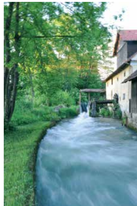
OŠ Preserje pri Radomljah, Jašovčev mlin

Obisk generalnega direktorja UNESCO Koichiro Matsuura na Osnovni šoli Cirila Kosmača Piran je minil v znamenju vrednot dediščine, direktor je podprl zamisel novega projekta Dediščina v rokah mladih – mladi posvojijo spomenik in sprejel častno pokroviteljstvo. V parku prijateljstva ob šoli je posadil oljko. Fotografija o tem dogodku je bila uvrščena na osrednji plakat – koledar ASP jubilejnega leta, obeležitve njegove 50. obletnice. Plakat so dobile vse šole svetovne mreže, Slovenija je spet vstopila v svet.