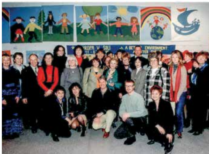
Strokovno srečanje evropskih izjemnih nacionalnih koordinatorjev (Outstanding National Co-ordinators, ONC) na Osnovni šoli Cirila Kosmača, Piran, 2002

šolah in UNESCO klubih navduševale in bogatile. Vključevali so se v akcije Mladi mobilizirajo mlade za novo tisočletje.