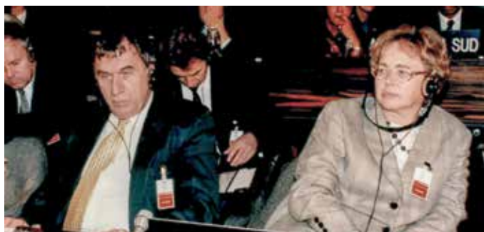
Na generalni konferenci UNESCO, 1999, Pariz