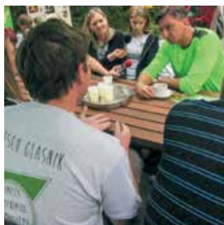
Stara trta (levo) in Kolesarjenje UNESCO glasnikov s predsednikom republike Borutom Pahorjem (desno)

v okviru festivala Lent v Mariboru, obisku generalne direktorice UNESCO v Sloveniji, Irine Bokove, Paradi učenja, Atletskemu mitingu v Velenju, Pikinem festivalu, Eurobasketu itd.